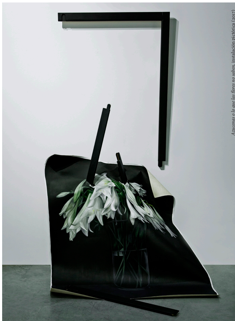
Azucenas o lo que las flores no saben, instalación pictórica (2017)

Navarro, Fernando A. (2019): «Medicina gráfica (y II): ¿en qué consiste?», Laboratorio del Lenguaje , (Internet): < https://medicablogs.diariomedico.com/laboratorio/2019/02/28/medicina-grafica-y-ii-en-que-consiste/ > [consulta: 28.II.2019].