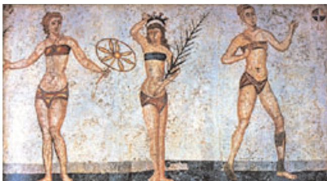
Figura 1. Mosaico romano de la Villa del Casale en Piazza Armerina (Sicilia, primera mitad del siglo IV).

Dado que comparto la opinión de García-Albea, escribo a Panace@ para rebatir la conclusión de Saladrigas y Pestana. Y lo haré contestando —e invitando al lector a que se conteste también conmigo— a cuatro preguntas que considero fundamentales para entender la cuestión.