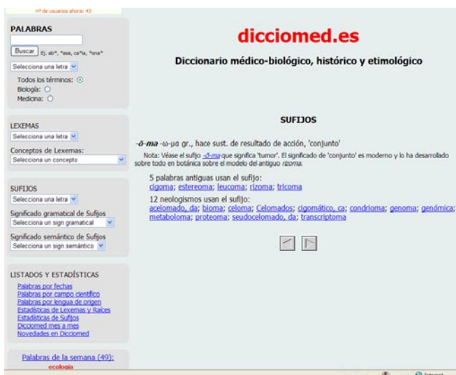
Figura 3: Pantalla de un sufijo en Dicciomed

Con este análisis, la información etimológica gana en profundidad, al remontarse a los antecedentes, y en extensión, porque invita a comprobar cómo se usa ese lexema en otros términos recogidos en el diccionario.