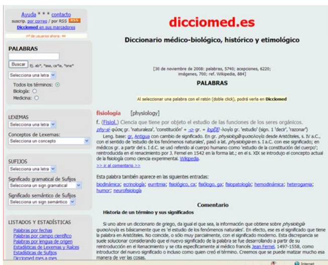
Figura 1. Pantalla de una palabra en Dicciomed

fico) y definición (al pulsar dos veces seguidas en una de las palabras de la definición, el usuario la podrá ver definida en Dicciomed , si es que está recogida).