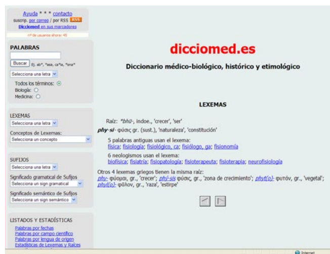
Figura 2: Pantalla de un lexema en Dicciomed

A continuación, el análisis de los elementos etimológicos que componen esa palabra en hipertexto, de forma que, al pinchar sobre ellos, el usuario pueda acceder a información detallada sobre los lexemas y sufijos que componen la palabra.