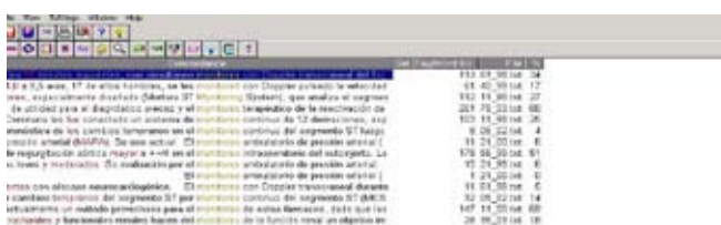
Figura 4: Concordancias de monitorear/monitoreo en la Argentina

En la Argentina, encontramos 14 apariciones de monitorear/monitoreo ; en 8 de ellas el término se emplea correctamente.