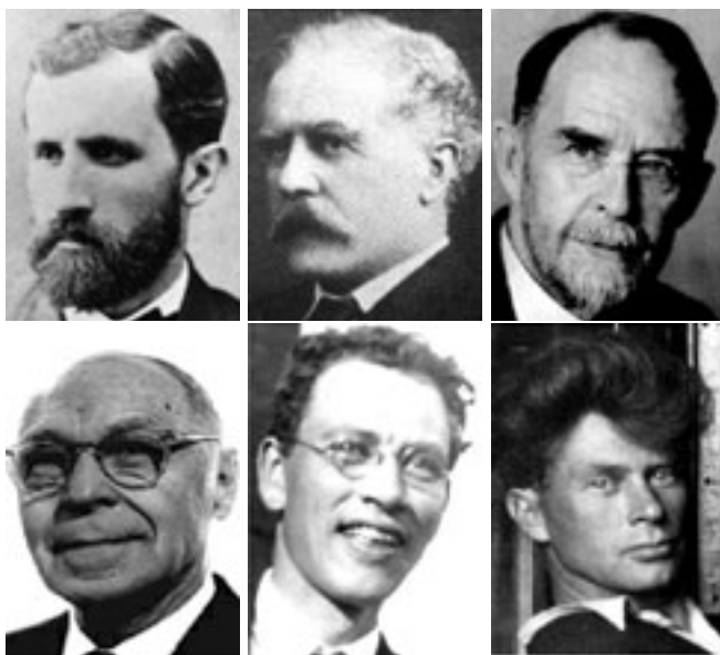
Arriba: Miescher, Garrod, Morgan; debajo: Muller, Sturtevant, Bridges.

El término genética fue propuesto en 1906 por el inglés William Bateson (1861-1926), ya que hasta entonces se venía utilizando el término «eugenética», acuñado por sir Francis Galton (1822-1911) en 1883. También fueron acuñados por Bateson los términos «alelomorfo», «cigoto», «homocigoto» y «heterocigoto». Hasta el momento la genética y la embriología se estudiaban mezcladas, sin diferenciar. Fue