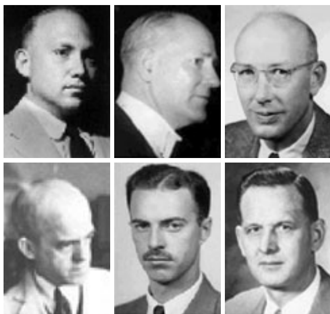
Arriba: Lederberg, Beadle, Tatum; debajo: Avery, MacLeod, McCarty.