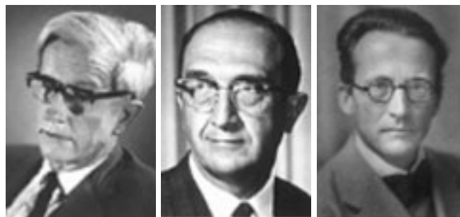
Delbrück, Luria, Schrödinger.

Debido a que la mayoría de los problemas biológicos eran prácticamente inaccesibles a la experimentación directa, muchos físicos, sobre todo físicos nucleares, se interesaron por ellos, y su incorporación fue determinante para el desarrollo de la biología molecular. Por ejemplo, Niels Bohr (1885-1962) escribió en 1933 un ensayo titulado «Light and Life» que influyó directamente en la forma de pensar de mu-