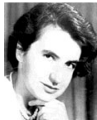
Arriba: Crick, Watson; debajo: Wilkins, Franklin.

un RNA soluble estable. Este RNA fue denominado inicialmente «RNA soluble», pero los experimentos posteriores de Zamecnik y Paul Berg (1926-*) demostraron que este RNA soluble «transfería» el aminoácido correcto, por lo que hoy se le denomina RNA de transferencia .