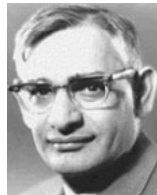
Arriba: Meselson, Stahl; debajo: Nirenberg, Khorana.