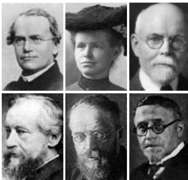
Arriba: Mendel, Stevens, Wilson; debajo: De Vries, Correns, Tschermak.

La naturaleza química de los cromosomas se estaba estudiando simultáneamente a la transferencia de los genes. En